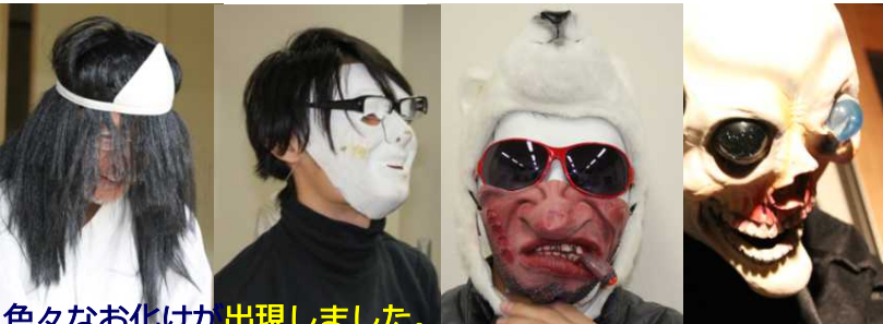
色々なお化けが出現しました。