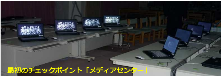
最初のチェックポイント「メディアセンター」