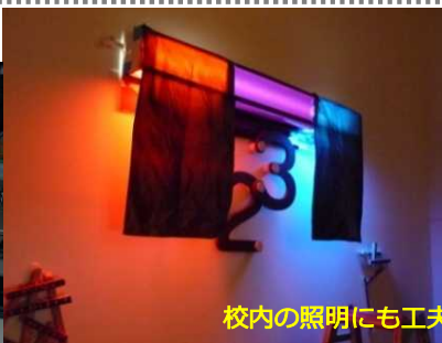
校内の照明にも工夫をこらしました。