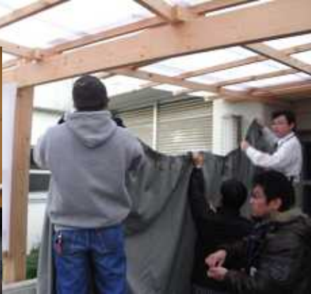
街灯を遮断する幕を張ります