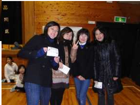
肝試し出発前の先生方（余裕の表情）