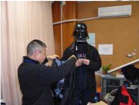
変装用の衣装合わせ

今回で三回目となる三日野での肝試し大会、今年は仮校舎（プレハブ）を含めた開催となりました。まだ陽も高い午後三時頃、おやじたちは少しずつ集まり始め、校舎内の色々な場所に仕掛けを作っていきます。工夫に工夫を重ねて、出来上がったそれぞれの仕掛けは、それぞれおやじたちの自信作です。