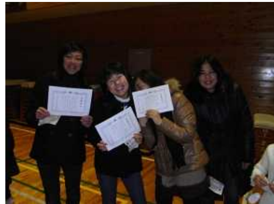
でも、戻ってきたら！？