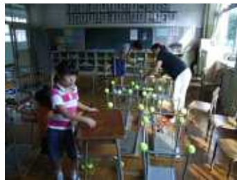
教室でのはめ込み作業