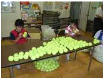
ボールに×印を付ける

午後2時過ぎ、冷房が完備された視聴覚室に場所を移し、テニスボール約1000個の穴開け作業が開始されました。今年1月、4月について3回目となり、おやじたちの手際もプロ級です。参加した子供たちがマジックペンでテニスボールに×印をつけ、おやじたちは、良く切れるカッターでテニスボールに穴を開けます。ボールの中に入っている液体を捨てれば、はめ込むボールの準備もOK。今回は、若手の先生方も参加し、これで14学級分全てが完了しました。